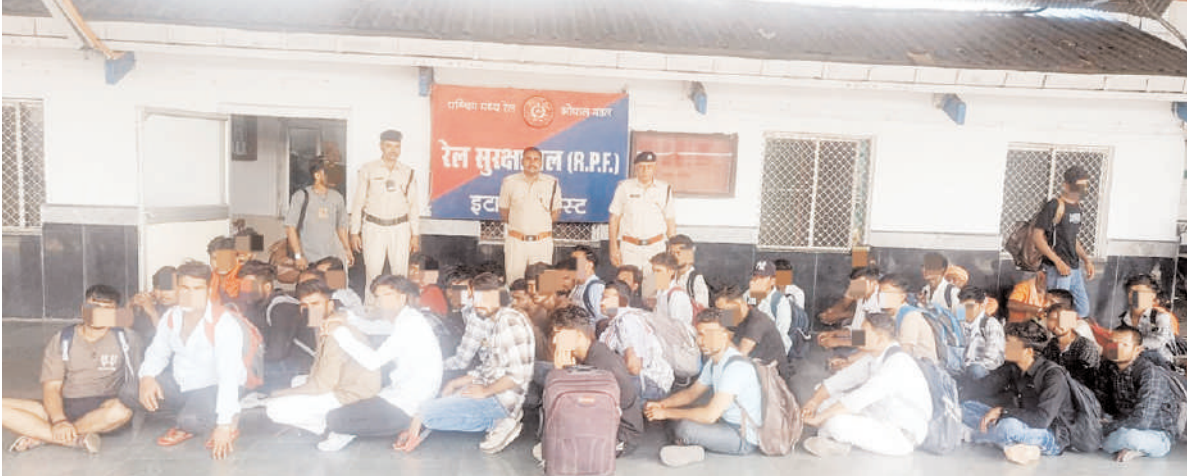
अलावा रेलवे अधिनियम का उल्लंघन करने वाले व्यक्तियों के विरुद्ध भी लगातार धरपकड़ अभियान जारी है। इसमें बिना कारण ट्रेन की

आरपीएफ की टीम द्वारा विशेष रूप से ट्रेनों और प्लेटफॉर्मों पर अनाधिकृत रूप से खाद्य सामग्री बेचने वाले अवैध वेंडरों और हॉकर्स पर निगरानी रखी जा रही है। इसके