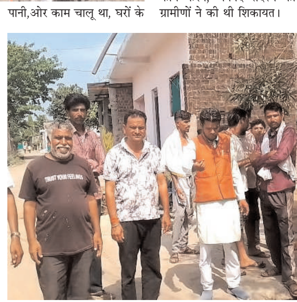
पानी, और काम चालू था, घरों के