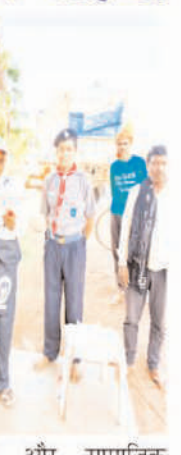
जनभागीदारी और सामाजिक सहयोग का उत्कृष्ट उदाहरण बनकर सामने आया है। जनगणना कार्य में लगे प्रणालियों ने भी स्काउट-गाइड वालंटियर्स के इस सराहनीय योगदान को प्रशंसा करते हुए कहा कि जनगणना जैसे महत्वपूर्ण राष्ट्रीय कार्यों में युवाओं की सक्रिय सहभागिता एक जागरूक, संगठित और सशक्त समाज के निर्माण की दिशा में प्रेरणादायी कदम है।