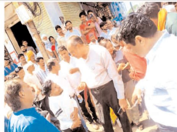
श्रमिकों ने योजनाओं की जानकारी सोमित होने की बात कही, जिस पर कलेक्टर ने अधिकारियों को श्रमिकों तक योजनाओं की

सीधी। कलेक्टर विकास मिश्रा द्वारा शनिवार को शहर के लालता चौक स्थित श्रमिक एकत्रीकरण स्थल का आकस्मिक निरीक्षण किया गया। निरीक्षण के दौरान उन्होंने वहां मौजूद श्रमिकों से सीधे संवाद कर उनकी समस्याओं, कार्य परिस्थितियों एवं शासन की विभिन्न जनकल्याणकारी योजनाओं के संबंध में जानकारी प्राप्त की। कलेक्टर ने श्रमिकों से चर्चा करते हुए पूछा कि उन्हें श्रम विभाग एवं शासन द्वारा संचालित योजनाओं की जानकारी प्राप्त हो रही है या नहीं तथा वे योजनाओं का लाभ ले पा रहे हैं या नहीं। कई