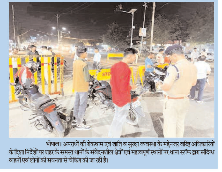
भोपाल। अपराधों की रोकथाम एवं शांति व सुरक्षा व्यवस्था के मद्देनजर वरिष्ठ अधिकारियों के दिशा निर्देशों पर शहर के समस्त थानों के संवेदनशील क्षेत्रों एवं महत्वपूर्ण स्थानों पर थाना स्टाफ द्वारा सदिग्ध वाहनों एवं लोगों की सघनता से चेकिंग की जा रही है।