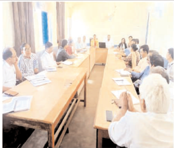
जलभराव की स्थिति उत्पन्न न हो। बैठक में बाणसागर एवं गुलाबसागर डैम के गेट एक साथ खोले जाने की स्थिति में प्रभावित होने वाले ग्रामों की सूची तैयार किए जाने की जानकारी दी गई। जल संसाधन विभाग के एसडीओ