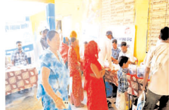
विधानसभा अंतर्गत ग्राम पंचायत दुआरी, सीधी विधानसभा अंतर्गत ग्राम पंचायत कोचिटा, चुरहट विधानसभा अंतर्गत ग्राम पंचायत उमरिहा तथा सिहावल विधानसभा अंतर्गत ग्राम पंचायत खुटेली में शिविर लगाए गए। शिविरों में स्वास्थ्य विभाग एवं आयुष विभाग के चिकित्सकों द्वारा सामान्य स्वास्थ्य परीक्षण, मौसमी बीमारियों की जांच, उपचार परामर्श एवं आवश्यक