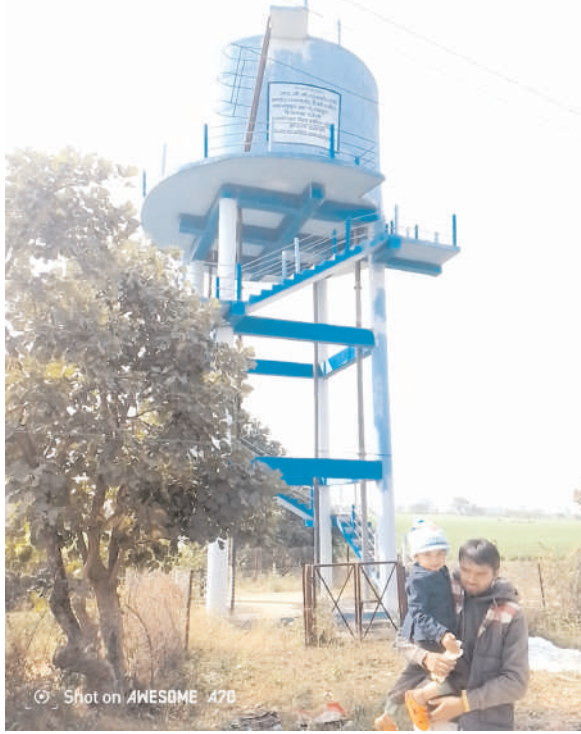
मुख्य पाइपलाइन क्षतिग्रस्त कर दी गई थी, जिसके उपरांत संपूर्ण योजना निष्क्रिय हो गई।

प्रचंड ग्रोथ में गांव भीषण पेयजल संकट से जूझ रहा है। स्थानीय निवासियों ने ग्राम पंचायत, सरपंच-सचिव एवं जल निगम विभाग पर चोर लापरवाही का आरोप लगाया है। ग्रामीणों के अनुसार मुख्य मार्ग के निर्माण कार्य के दौरान लोक निर्माण विभाग द्वारा नल-जल योजना की