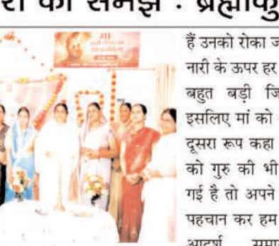
हैं उनको रोका जा सके हर नारी के ऊपर हर मां के ऊपर बहुत बड़ी जिम्मेदारी है इसलिए मां को भगवान का दूसरा रूप कहा जाता है मां को गुरु की भी उपाधि दी गई है तो अपने स्वरूप को पहचान कर हम समाज को आदर्श समाज मूल्यवान समाज बनाने में सहयोग प्रदान करें अपने परिवार को अपने बच्चों को श्रेष्ठ संस्कार आरोपित करने में अपना समय देकर बच्चों को आदर्शवान, चरित्रवान, व्यसन मुक्त बनाकर मूल्यवान समाज बनाने में अपना सहयोग प्रदान करें आज सभी संकल्प करेंगे कि हम अपनी मां की भावनाओं को समझेंगे उनका सम्मान करेंगे यही सबसे बड़ा मां के लिए उपहार है।

पन्ना। ब्रह्माकुमारी विद्यालय पन्ना के द्वारा अमानगंज में मातृ दिवस पर एक आध्यात्मिक कार्यक्रम का आयोजन किया गया मां सुखी परिवार की आधारशिला, विषय पर संबोधित करते हुए ब्रह्माकुमारी बहन ने कहा कि आज बहुत महत्वपूर्ण दिन है क्योंकि आज हम उस शक्ति, ममता और उस त्याग को प्रणाम करने के लिए एकत्रित हुए हैं जिसे हम मां कहते हैं, मां केवल एक शब्द नहीं है बल्कि प्रेम करुणा, त्याग और भगवान का जीवंत स्वरूप है संसार में यदि कोई बिना स्वार्थ के प्रेम करता है तो वह सिर्फ मां ही है, मां और मातृभूमि स्वर्ग से भी महान है एक सच्ची आदर्श मां बनकर