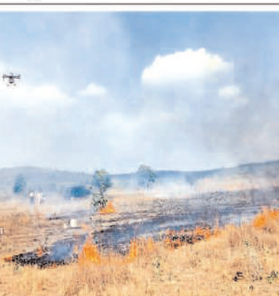
पाना कई बार अत्यंत कठिन हो जाता है। कई परिस्थितियों में आग तीव्र होने पर वन कर्मचारियों को सीधे आग के समीप कार्य करना पड़ता है, जिससे उनके जीवन को गंभीर जोखिम उत्पन्न होता है। वर्तमान में अधिकांश वन अग्नियों को मैनुअल तरीकों जैसे फायर

पन्ना। दक्षिण पन्ना वनमण्डल द्वारा वन अग्नि प्रबंधन हेतु एक अभिनव पहल करते हुए शाहनगर वन परिक्षेत्र में ड्रोन एवं फायर रिटार्डेंट मोनो अमोनियम फॉस्फेट आधारित मिश्रण की सहायता से एरियल फायर फाइटिंग का प्रायोगिक प्रदर्शन किया गया। यह प्रयास देश में अपनी तरह के प्रारंभिक प्रयासों में से एक माना जा रहा है, जिसमें वनगति नियंत्रण हेतु आधुनिक तकनीक एवं वैज्ञानिक दृष्टिकोण का उपयोग किया गया। इस कार्य में दक्षिण पन्ना वनमण्डल के साथ राज्य वन अनुसंधान संस्थान का तकनीकी सहयोग भी प्राप्त हुआ।